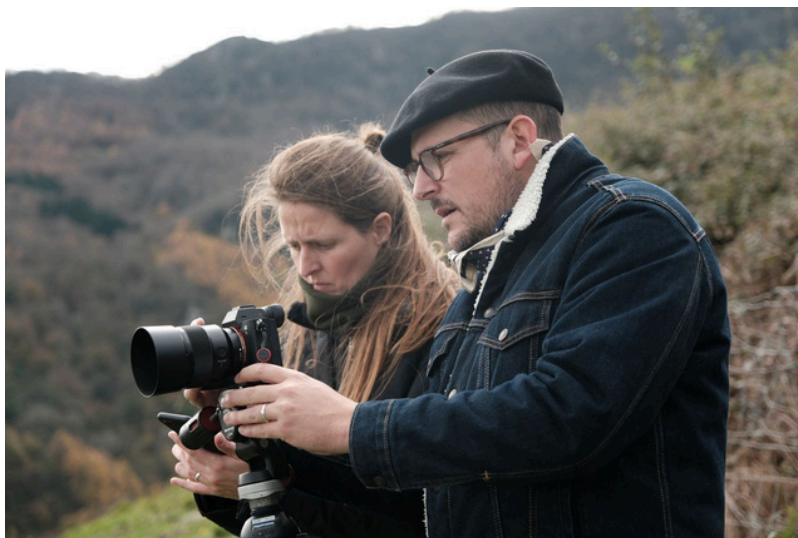
Nomad Studioko kideak, Sormenaren Kabia 2023

Guztira bi proiektu hautatuko dira, eta horietako bat 18-35 urte bitarteko artistei zuzenduko da.