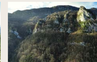
Kareharrizko gailurrak, harkaiztietako kobak eta zuloak