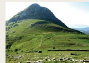
Larreak eta sastrakak

Paisaia horietan mehatxatutako fauna espezieak bizi dira: hildako egurrean bizi diren intsektu deskonposatzaileak, kiropteroak (saguzarrak) eta hegazti harrapariak (sai arrea eta sai zuria).